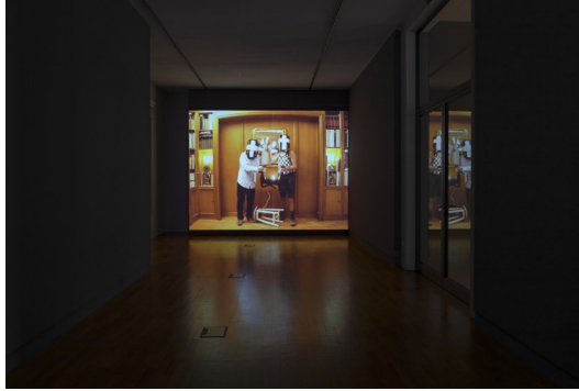
Gabbi Cattani, Holdin' the dog (d'après Edward Kienholz) , 2021 (Installationsansicht), Foto: Sebastian Bühler Gabbi Cattani, Holdin' the dog (d'après Edward Kienholz) , 2021 (installation view), photo: Sebastian Bühler